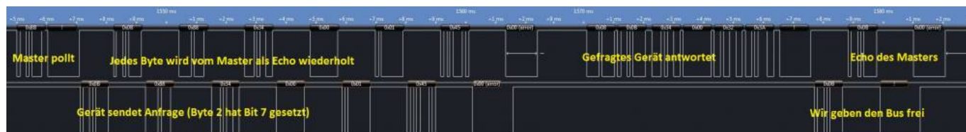
Abfrage eines anderen Gerätes