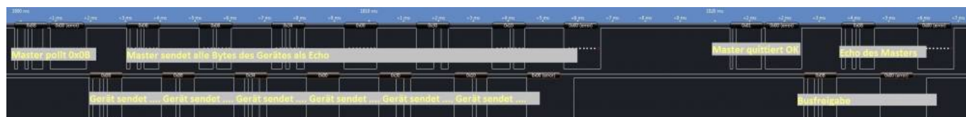
Setzen eines Wertes