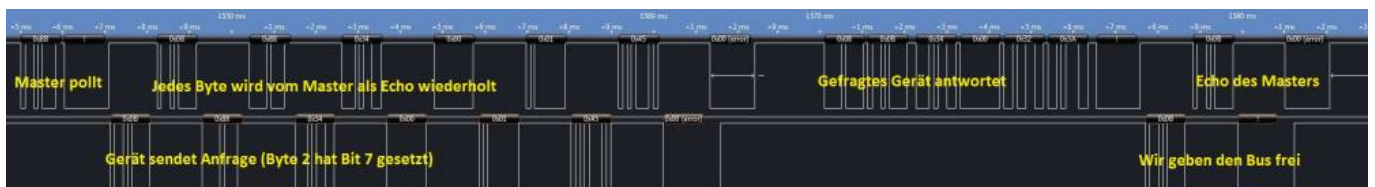
Abfrage eines anderen Gerätes