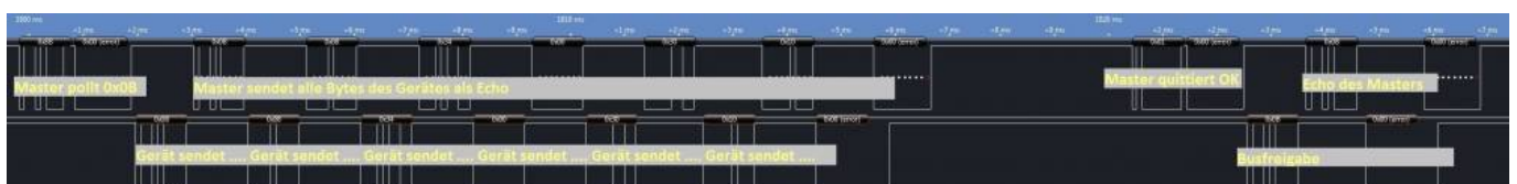
Setzen eines Wertes