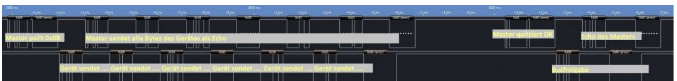
Setzen eines Wertes