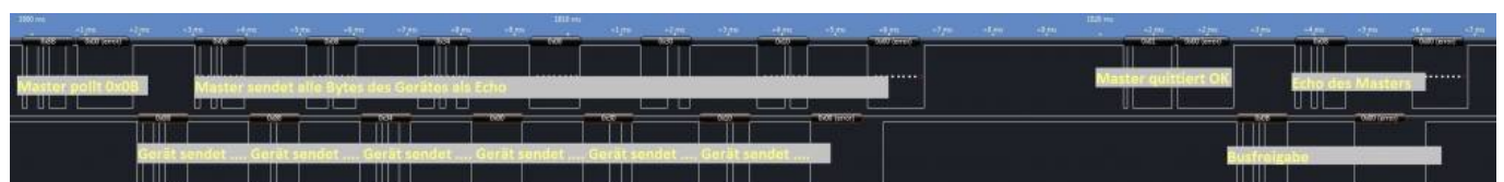
Setzen eines Wertes