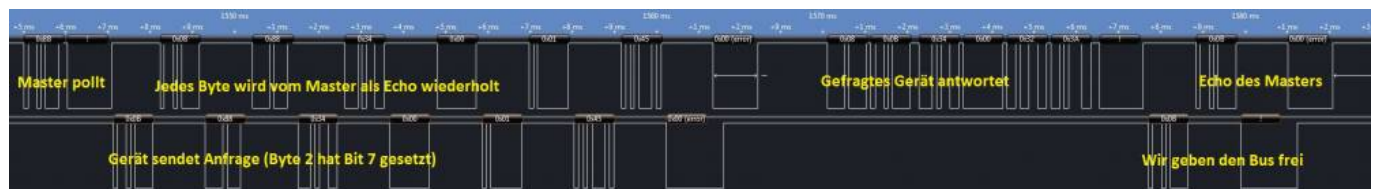
Abfrage eines anderen Gerätes