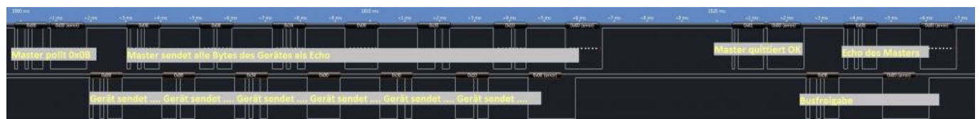
Setzen eines Wertes