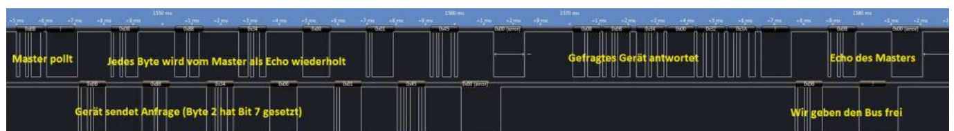
Abfrage eines anderen Gerätes